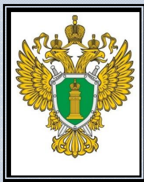
Герб Прокуратуры РФ

С 14-ти летнего возраста лицо подлежит уголовной ответственности. С 16-ти лет подлежит административной ответственности.